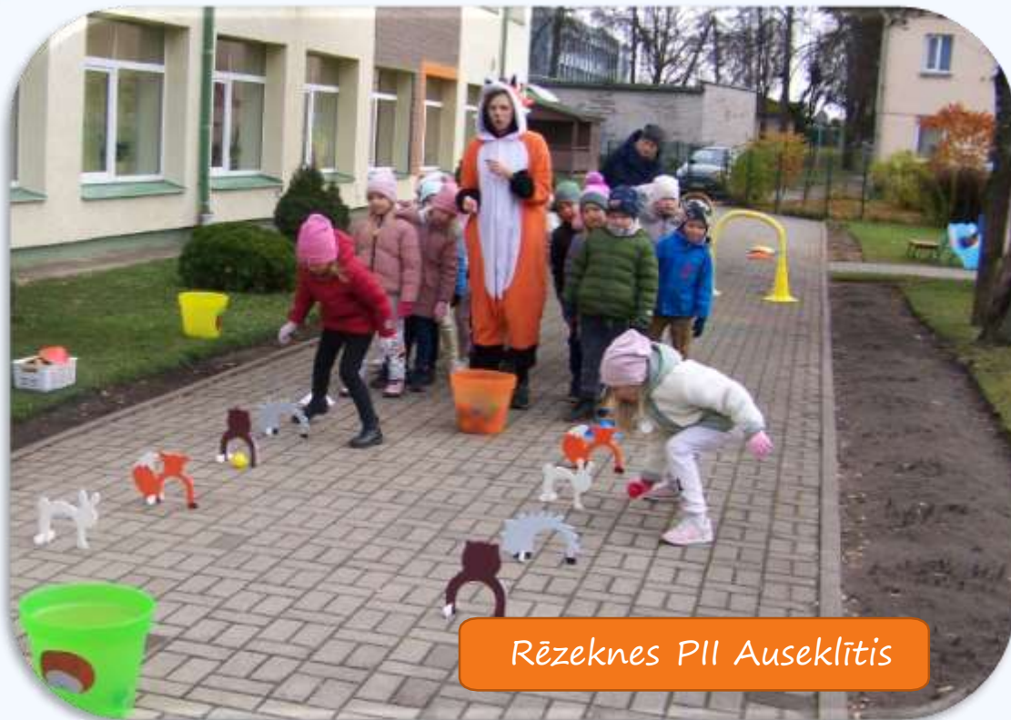
Rēzeknes PII Auseklītis