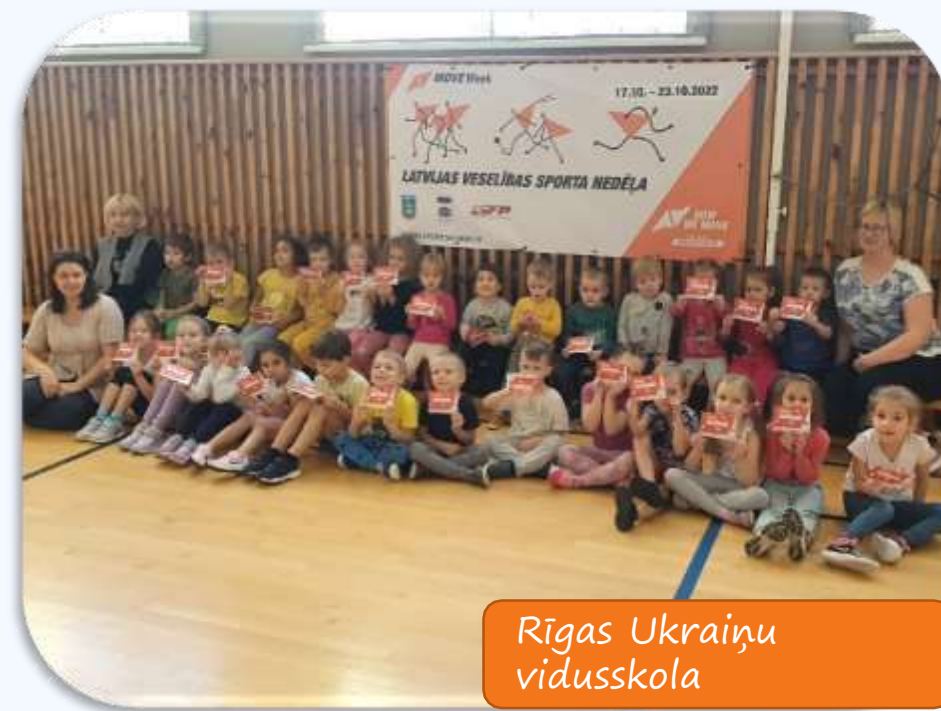
Rīgas Ukrainu vidusskola