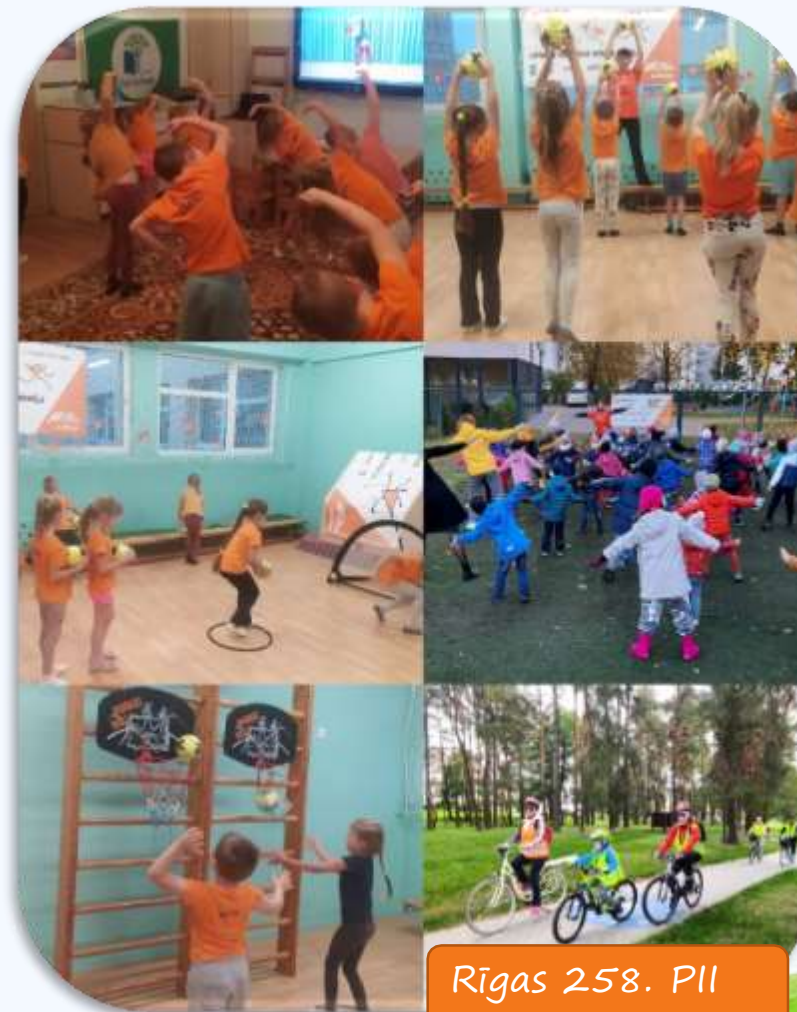
Rīgas 258. PII