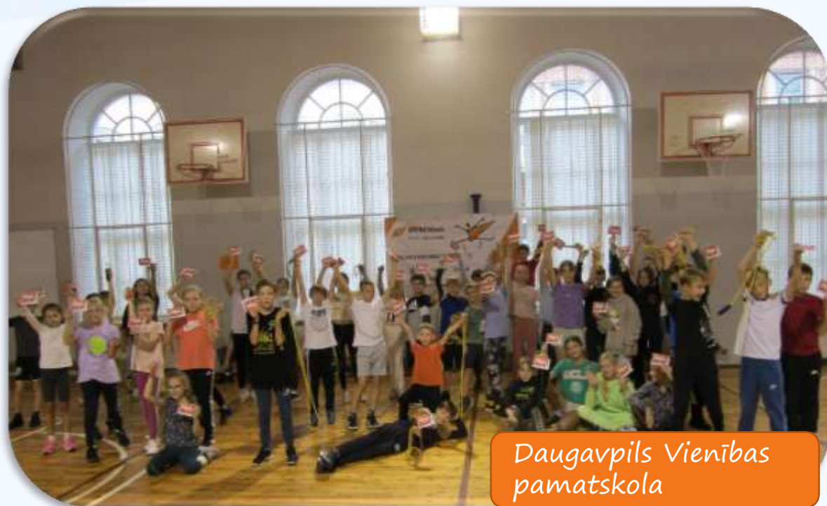
Daugavpils Vienības pamatskola