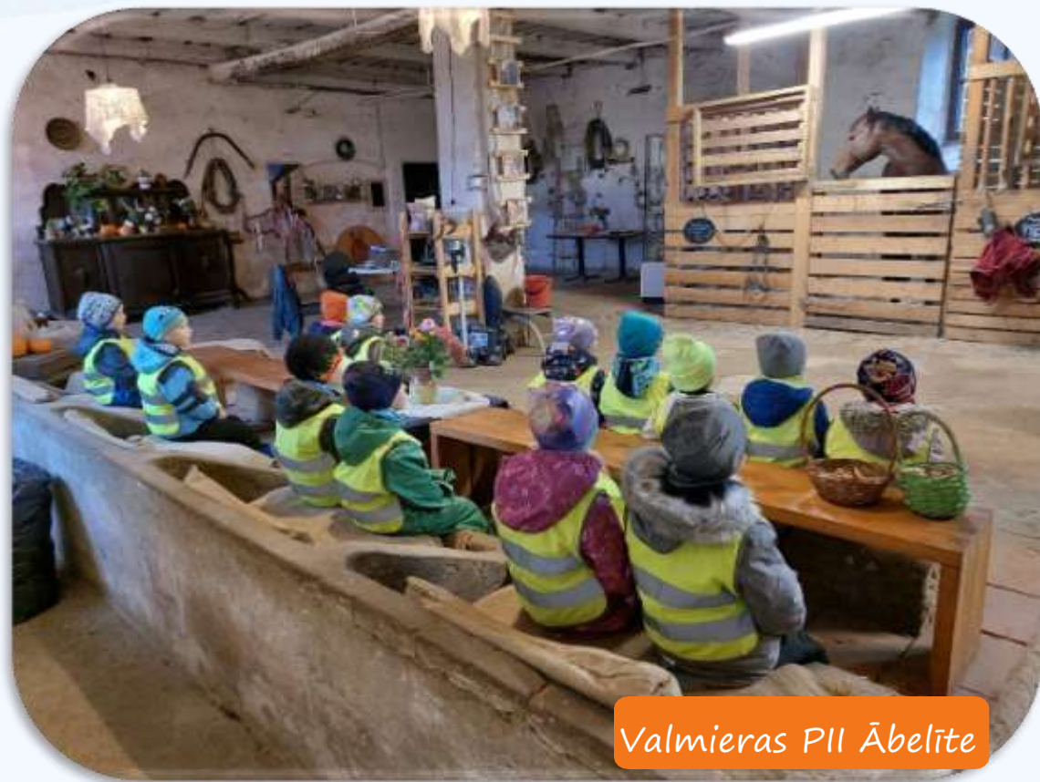
Valmieras PII Ābelīte