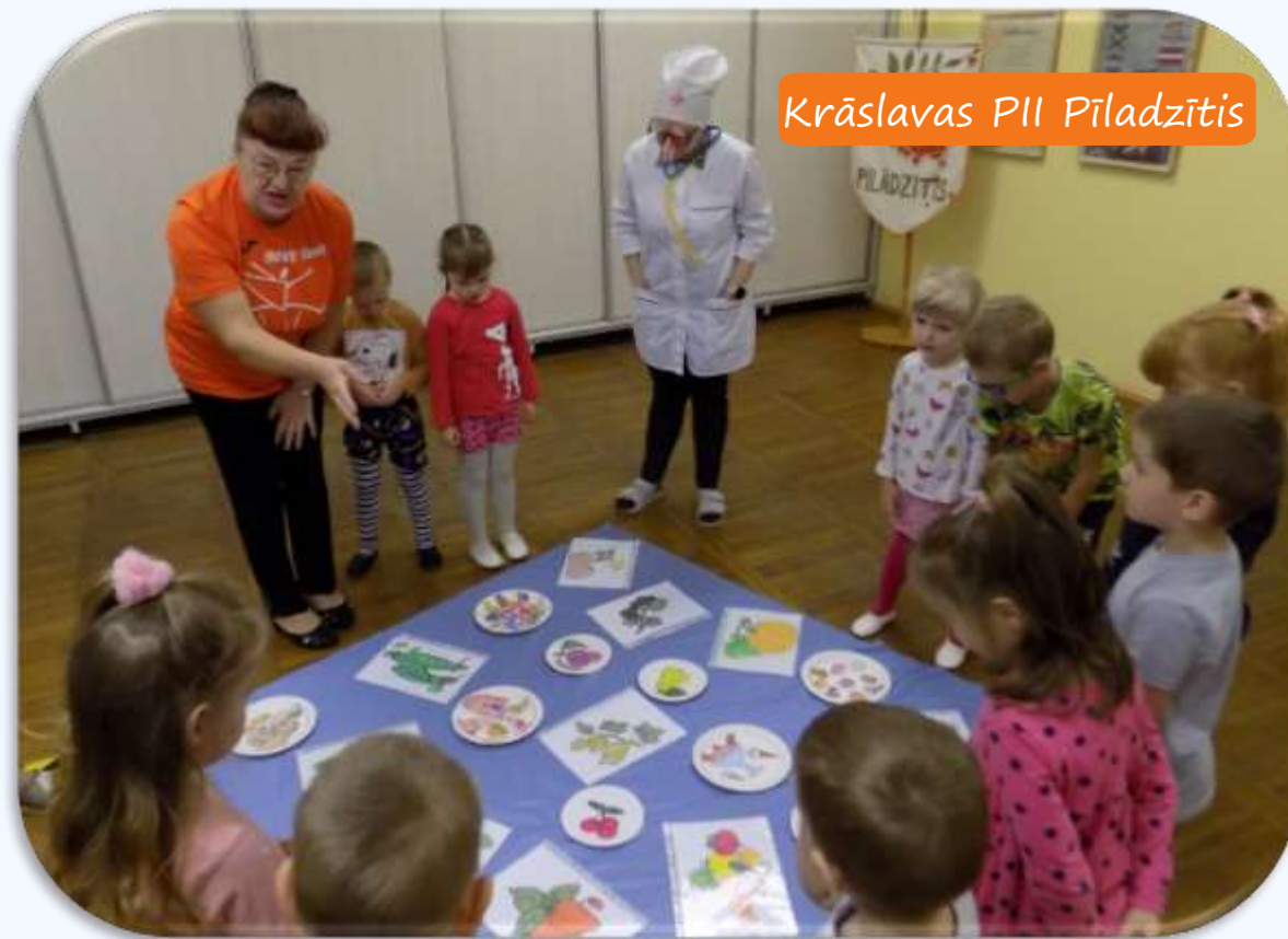
Krāslavas PII Pīlādītis